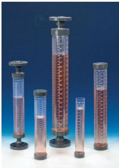
CV - PVC 标定柱