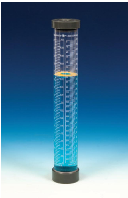
CV#4 带高可视性液面浮动指示器